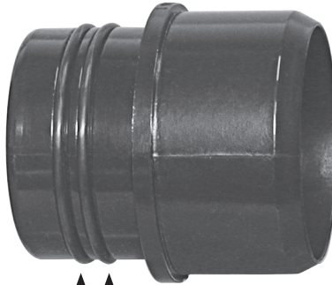
805-0232 O-Rings Juntas tóricas Joints toriques

417-2201 Tailpiece Alcachofa de aspiración Raccord de vidange